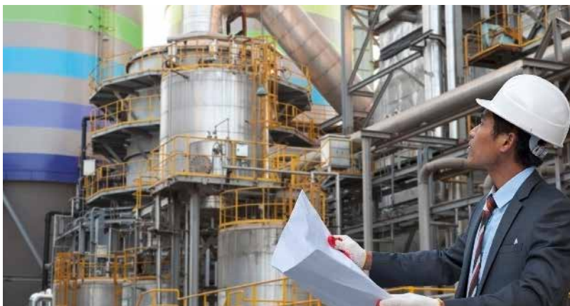
Enhanced Video Solutions für Industrieanlagen und kritische Infrastrukturen // 05